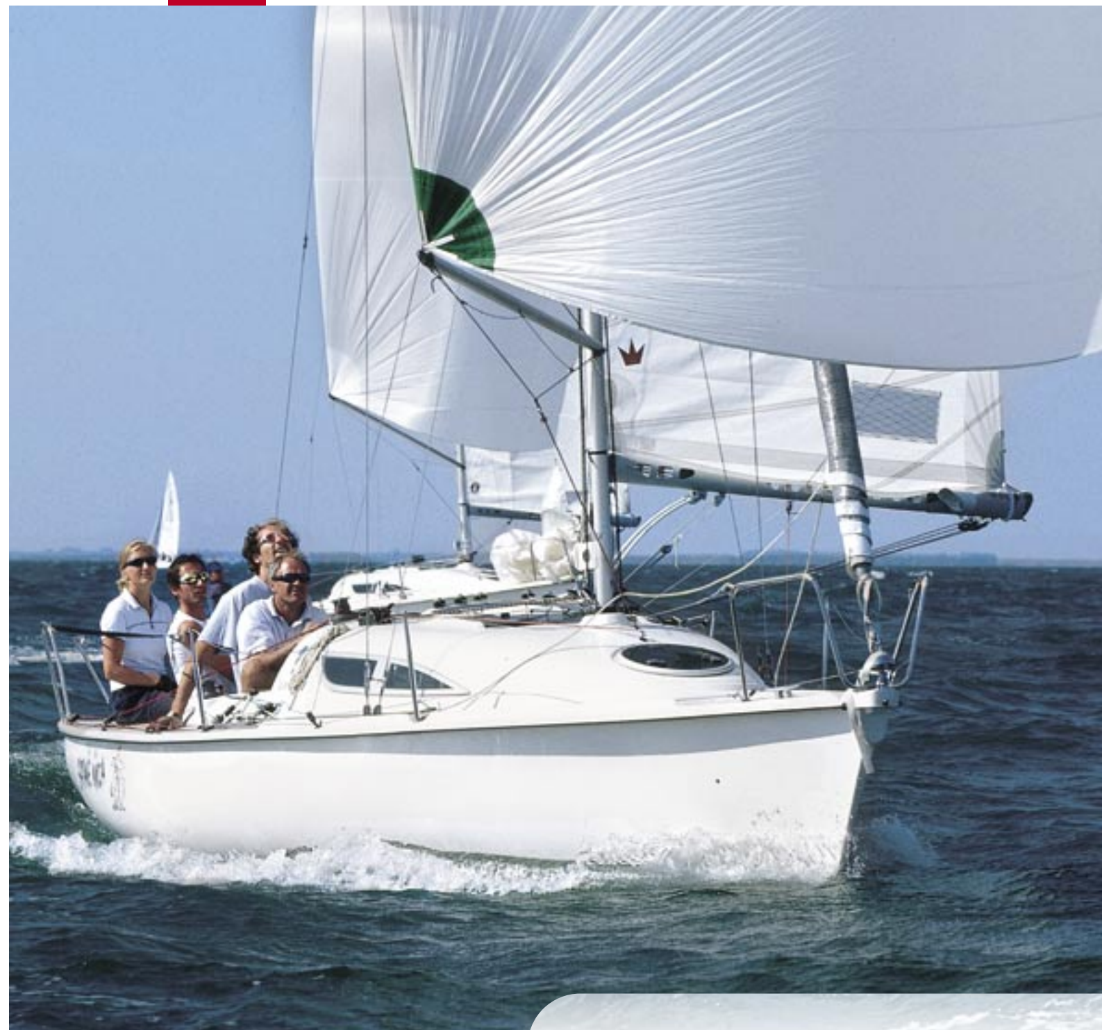
Conception & Impression 05 46 30 29 29 - - Document et photos non contractuels.